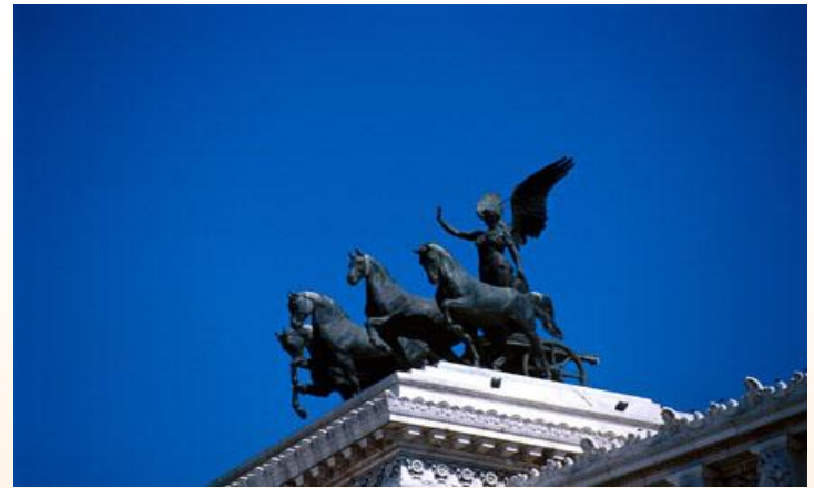
Quadriga dell'unità - 1927