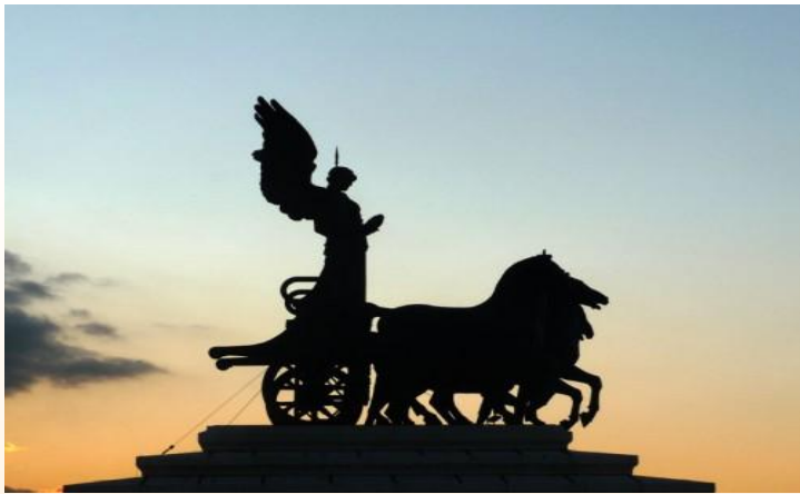
Quadriga della libertà - 1927