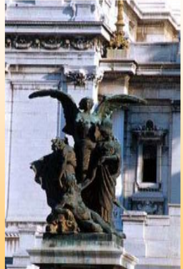
Il Pensiero di Giulio Monteverde.